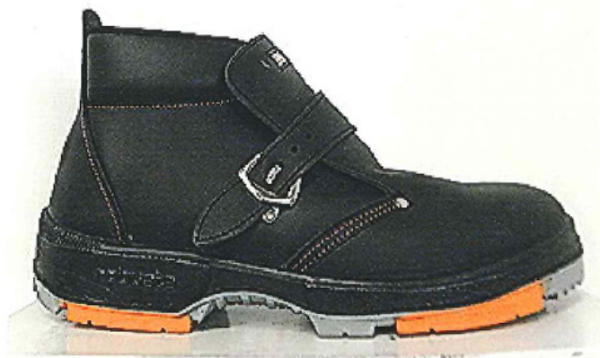
FOTO SUOLA PHOTO OF OUTSOLE